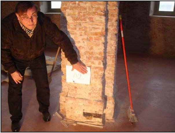
Figura 2.3: Campionamento zona A prima dell'impacco

nella zona A, in entrambi i casi ad una profondità fra i 2 ed i 3 cm all'interno di un singolo mattone (fig 2.5 e fig. 2.6).