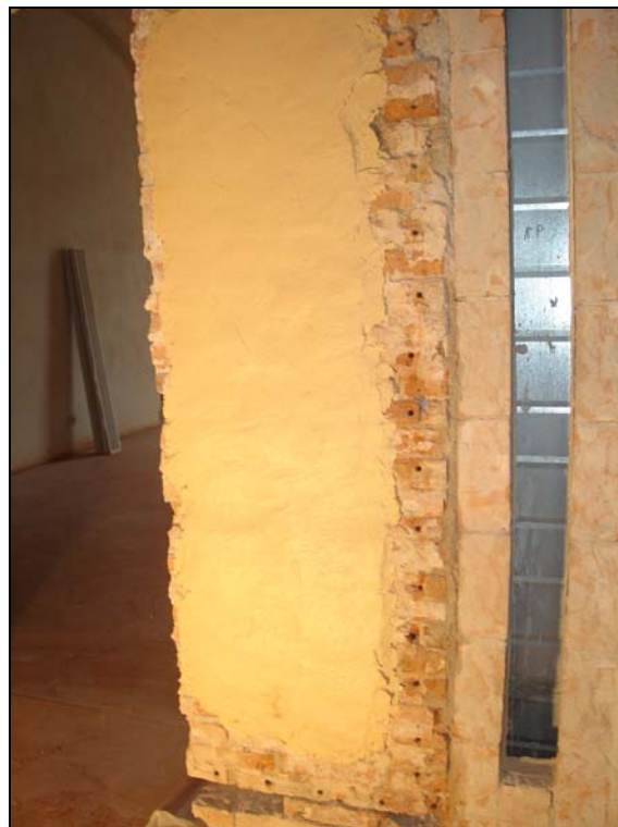
Figura 2.7: Impacco applicato nella zona C

La polvere è stata ottenuta operando un foro a mezzo trapano e prelevando la polvere all'interno dello stesso foro. Immediatamente dopo è stato applicato l'impacco risanante (fig. 2.7). Dopo la rimozione dell'impacco, che è rimasto sulla muratura per 20 giorni, è stato eseguito un secondo prelievo delle polveri con le stesse modalità del campionamento precedente, operando il nuovo foro accanto a quello precedente.