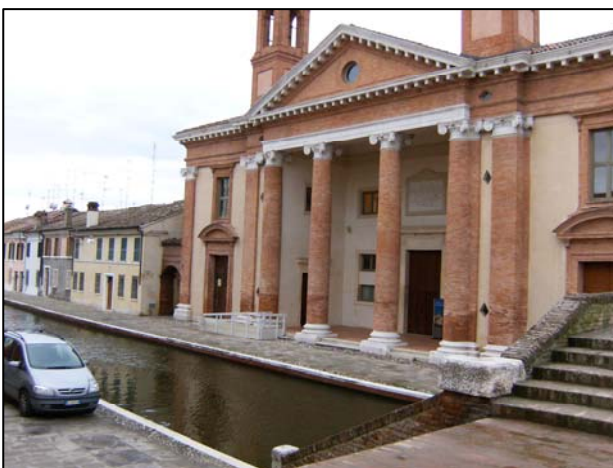
Figura 2.1: prospetto fronte via Agatopisto

L'ex ospedale "San Camillo" o "Degli infermi" è un edificio settecentesco edificato completamente in laterizio ed inserito nel contesto urbano del centro storico di Comacchio, pertanto circondato da canali di acqua salmastra (fig 2.1 e fig. 2.2).