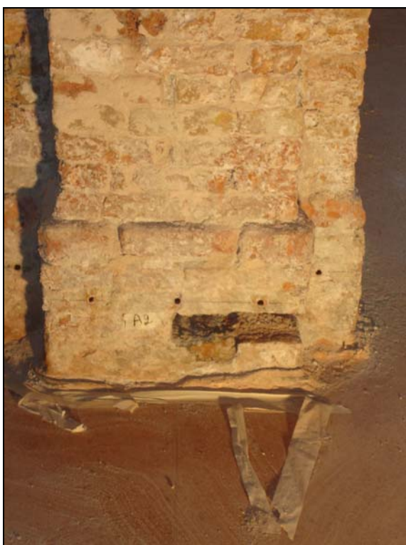
Figura 2.3: zona A ricca di sali

In base a quanto già enunciato nell'introduzione, le indagini oggetto della presente disamina sono finalizzate alla verifica della reale efficacia dell'estrazione dei sali tramite impacco. A tale scopo è stato progettato un campionamento a carico di due zone, al piano terra dell'edificio, che sono state identificate come zone campione rappresentative dei due estremi del fenomeno di risalita: la zona denominata A , a forte risalita capillare e presenza di vistose efflorescenze in superficie; la zona denominata C , a risalita capillare molto più contenuta e pressoché assenza di efflorescenze in superficie (Fig 2.3 e Fig. 2.4).