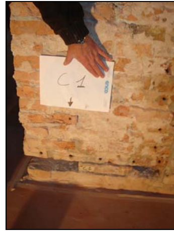
Figura 2.4: Campionamento zona C prima dell'impacco

La polvere è stata ottenuta operando un foro a mezzo trapano e prelevando la polvere all'interno dello stesso foro. Immediatamente dopo è stato applicato l'impacco risanante (fig. 2.7). Dopo la rimozione dell'impacco, che è rimasto sulla muratura per 20 giorni, è stato eseguito un secondo prelievo delle polveri con le stesse modalità del campionamento precedente, operando il nuovo foro accanto a quello precedente.