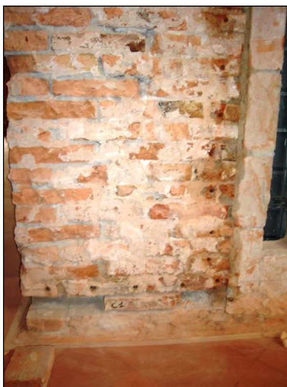
Figura 2.4: zona C povera di sali

Nelle due zone suddette sono state eseguite le operazioni "campione" che eventualmente andranno poi estese a tutto l'edificio, o comunque alle parti più degradate dello stesso. Sia nella zona A che nella zona C, il campionamento per la determinazione del contenuto di sali solubili residui, è stato effettuato dopo circa un mese dall'iniezione di composti silanici che costituiscono la barriera chimica alla risalita di acqua per capillarità. Il campionamento è stato effettuato prelevando le polveri a circa 30 cm dal suolo nella zona C e a circa 40 cm dal suolo