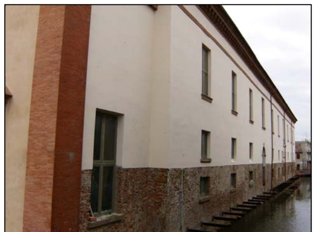
Figura 2.2: prospetto lato canale